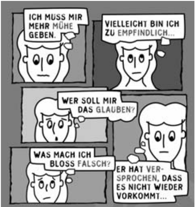
Rosalind B. Penfod, Und das soll Liebe sein? © Eichbornverlag